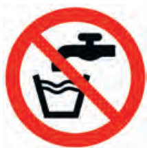
Abbildung 2: Zeichen für „Kein Trinkwasser“

Nichttrinkwasserleitungen sind nach der Trinkwasserverordnung und nach DIN 2403 eindeutig und dauerhaft farblich unterschiedlich zu kennzeichnen, damit es zu keiner Verwechslung kommt. Alle Entnahmestellen der RWNA sind mit einem Schild „Kein Trinkwasser“ oder dem Bild (Abb.2) zu kennzeichnen.